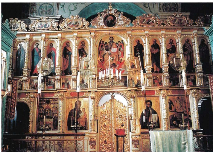
Późnorenesansowy ikonostas, którego część ikon pochodzi z XVI w. (ST)